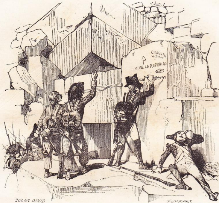
Des soldats grimpaient sur les pyramides, et y gravaient leurs noms avec la pointe de leur baïonnette.

L'ennui fut le plus grand mal dont la majeure partie des passagers eurent à se défendre. Pendant les premiers jours on eut recours au jeu; mais comme ce jeu n'était rien moins que modéré et que les ressources des joueurs n'étaient pas inépuisables, l'argent de tous se trouva bientôt réuni dans quelques poches pour n'en plus sortir; alors on se jeta sur la lecture, et la bibliothèque, que le général en chef avait lui-même choisie, fut d'une grande ressource. Arnault, qui en avait la clef, devint un homme fort important. En la lui confiant, Napoléon lui avait donné pour instruction qu'il ne devait prêter de livres qu'aux personnes auxquelles il était permis d'entrer dans la chambre du conseil, qui tenait lieu de salon de réunion, et aux individus qui faisaient partie du gros état-majör , encore devaient-ils les lire sans se déplacer.